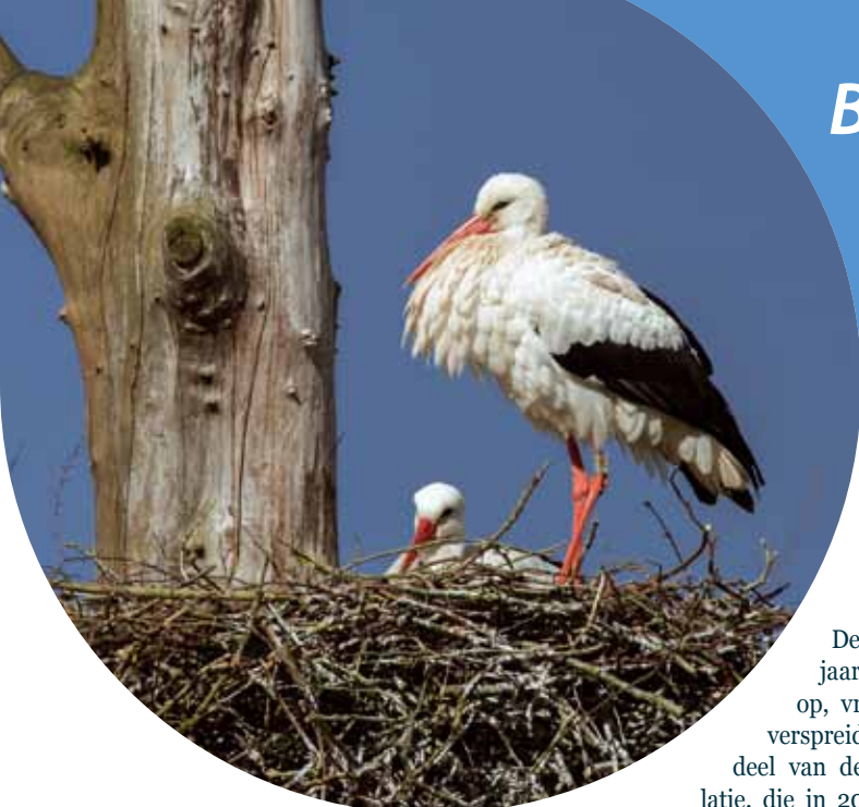
Ooievaar, nest in dode kastanjeboom. De Schiphorst 1 april 2013.

In 2012 sloegen de werkgroep STORK en Sovon de handen ineen om de verzameling van nestgegevens van Ooievaars een nieuwe impuls te geven. We ontwikkelden, met steun van Vogelbescherming Nederland, een laagdrempelige invoermodule voor nesteigenaren, contactpersonen en beheerders van ooievaarsstations: stork.sovon.nl . In wezen een variant-op-maat van Nestkaart Light.