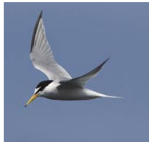
Dwergstern, 2 juni 2007.

Ook de Dwergstern is bij ons kustgebonden. In 2008 waren er in ons land 23 kolonies, waarvan er echter slechts 11 tenminste 10 broedparen telden. De grootste kolonie was die van de Hooge Platen met 250 paren (figuur 1). De kolonie op de Stampersplaten in het Grevelingenmeer telde slechts 42 paren