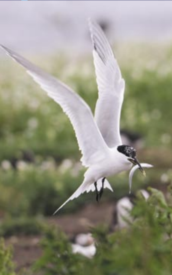
Grote Stern, 20 juni 2007, Broedkolonie Inner Farne UK.