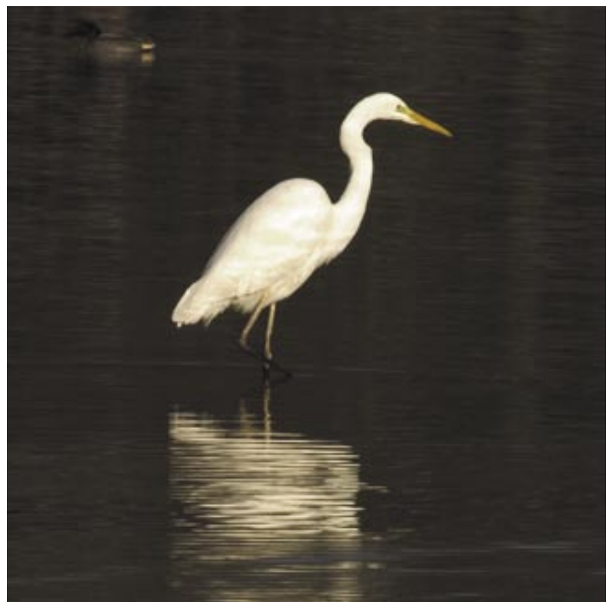
Grote Zilverreiger.