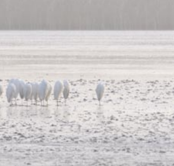
Slaapplaats van Grote Zilverreigers op het ijs van het Vollenhovermeer, 31 december 2008.