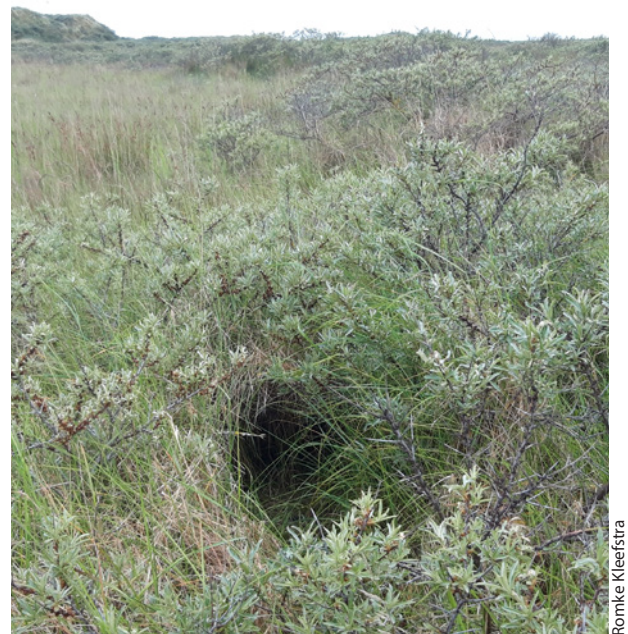
Velduilennest onder Duindoorn op de Oosterkwelder van Schiermonnikoog, 5 juni 2023. Nest of Short-eared Owl underneath Sea Buckthorn on the Dutch Wadden Sea island of Schiermonnikoog.

Allereerst is een woord dank op zijn plek voor de vele vrijwilligers die in Friesland broedvogels inventariseren en beschermen onder de vlag van organisaties als Sovon