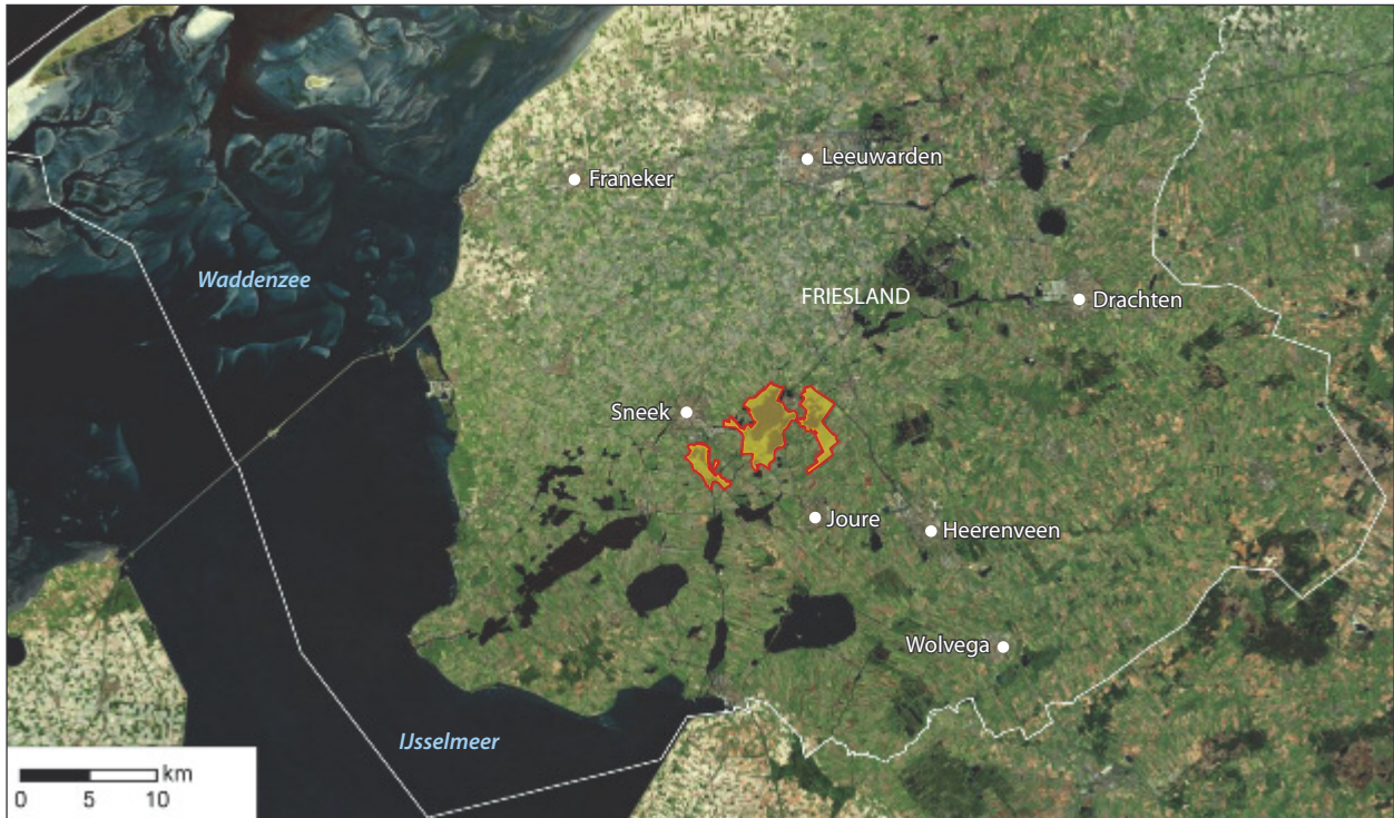
Figuur 1. Ligging van het centrale merengebied in Friesland. Situation of the central lake district in the province of Friesland.