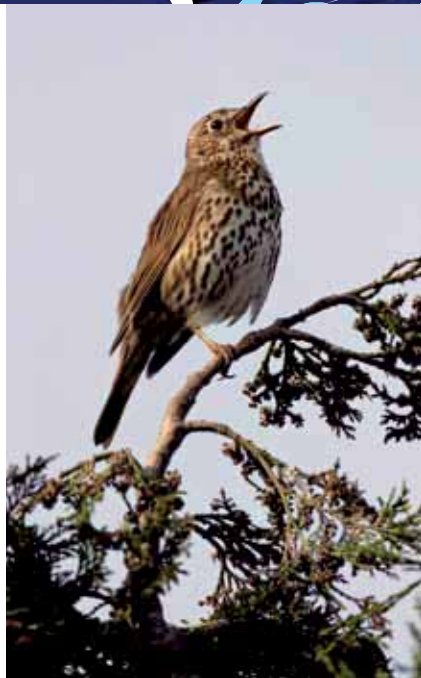
Zanglijster, 15 juni 2003.

Alle tellers bedankt voor de deelname en leuke reacties en hopelijk worden ontbrekende tellingen alsnog ingevoerd. Begin 2011 wordt een opschoonactie uitgevoerd. Wanneer tellers niet reageren op een oproep via email om hun beloofde telling alsnog