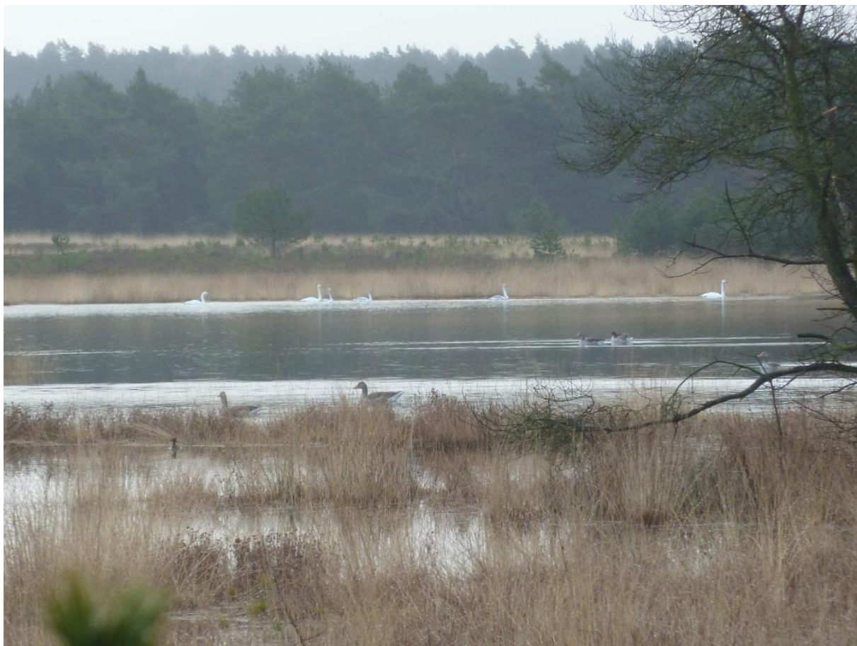
Overnachtende Wilde Zwanen op de Gerritsfles, 20 maart 2016.