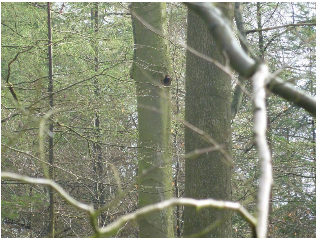
Nestholte inspectie door Zwarte Specht in beuk in het Spelderholt, 13 april 2016.