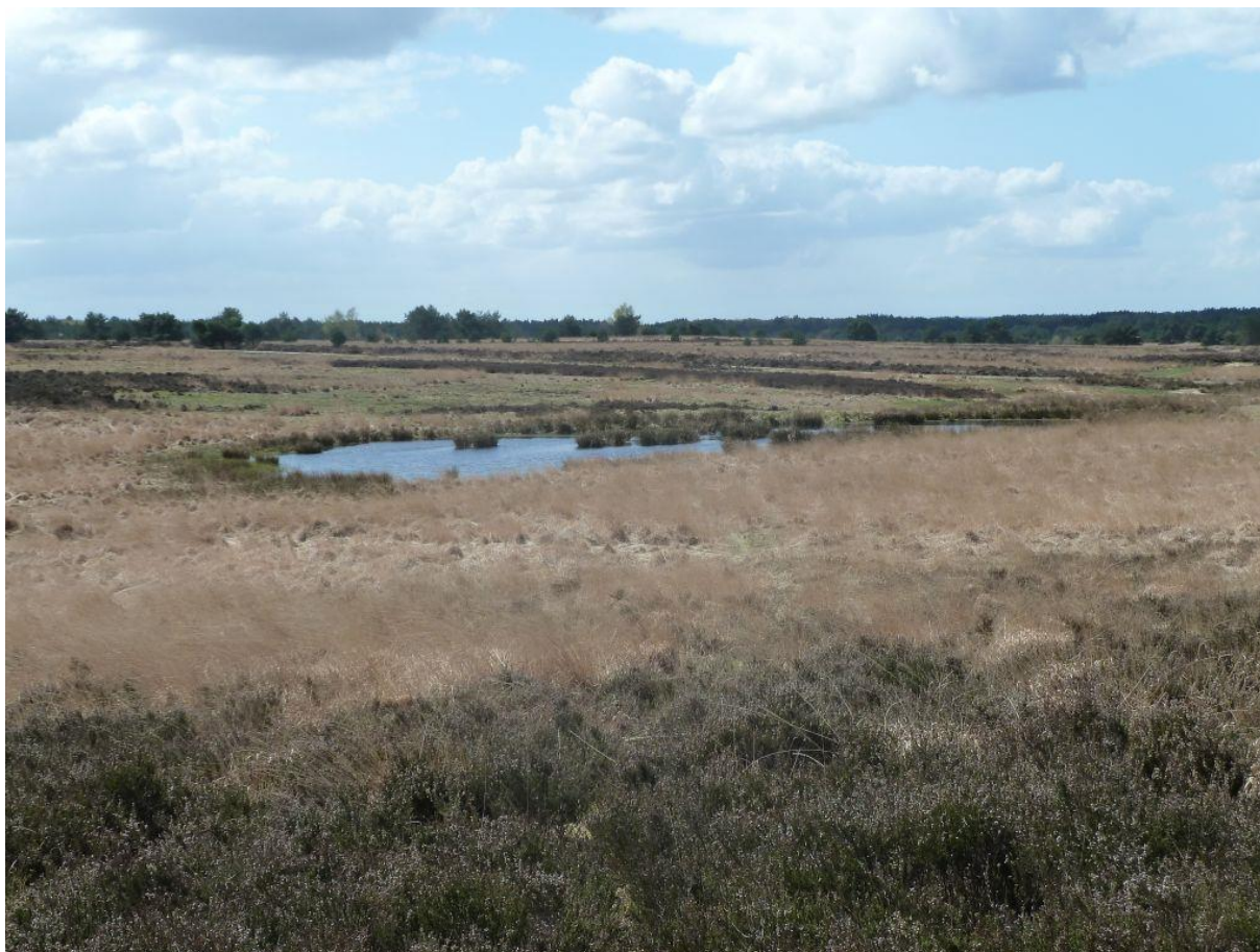
Karakteristiek beeld van de Hoog-Buurlosche Heide, 16 mei 2016.

Plaatselijk komen graslandvegetaties en akkers voor in het studiegebied. Meest karakteristiek is Hoog Buurlo, een gehucht dat onder andere een woonhuis en schaapskooi bevat, omringd door wildwallen en oude beuken- en eikenbossen. Een deel van de karakteristieke akker wordt jaarlijks ingezaaid met ouderwetse granen. Een andere grote akker ligt op het ISK, nabij de Gerritsfles en is uit productie genomen. De akker diende in het voorjaar van 2016 als wengebied voor de Wisenten en is daarvoor voorzien van een grofwildkerend raster, na enige weken gewenningstijd zijn enkele toegangshekken geopend, zodat de dieren vanaf toen permanent in en uit kunnen wisselen.