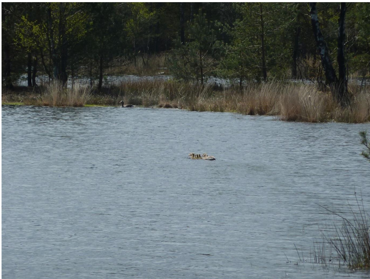
Een van de weinige paren met jongen van de Grauwe Ganzen in de Gerritsfles, 1 mei 2016.

De bezoeken na 15 mei leverden ook geen Grauwe Ganzen meer op. Zeer waarschijnlijk zijn de ganzen, nadat de broedcyclus was voltooid, vertrokken naar plekken met meer voedsel en om te ruïen.