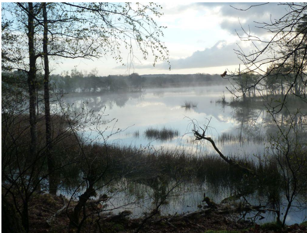
De Gerritsfles is een uniek ven op de Veluwe, 24 april 2016.

Ondanks recente kap van naaldbos, met name douglas en Japanse lariks, nam de Vuurgoudhaan nauwelijks af. Kuifmezen namen verder af in Ugchelen-Hoenderloo. De laatste jaren doet deze soort het beduidend minder goed in de grove dennenbossen op de Veluwe. Invasiesoorten als Sijs en Kruisbek waren redelijk aanwezig, maar in andere jaren werden hogere aantallen geteld. De Putter vestigde zich als nieuwe broedvogel in het gebied.