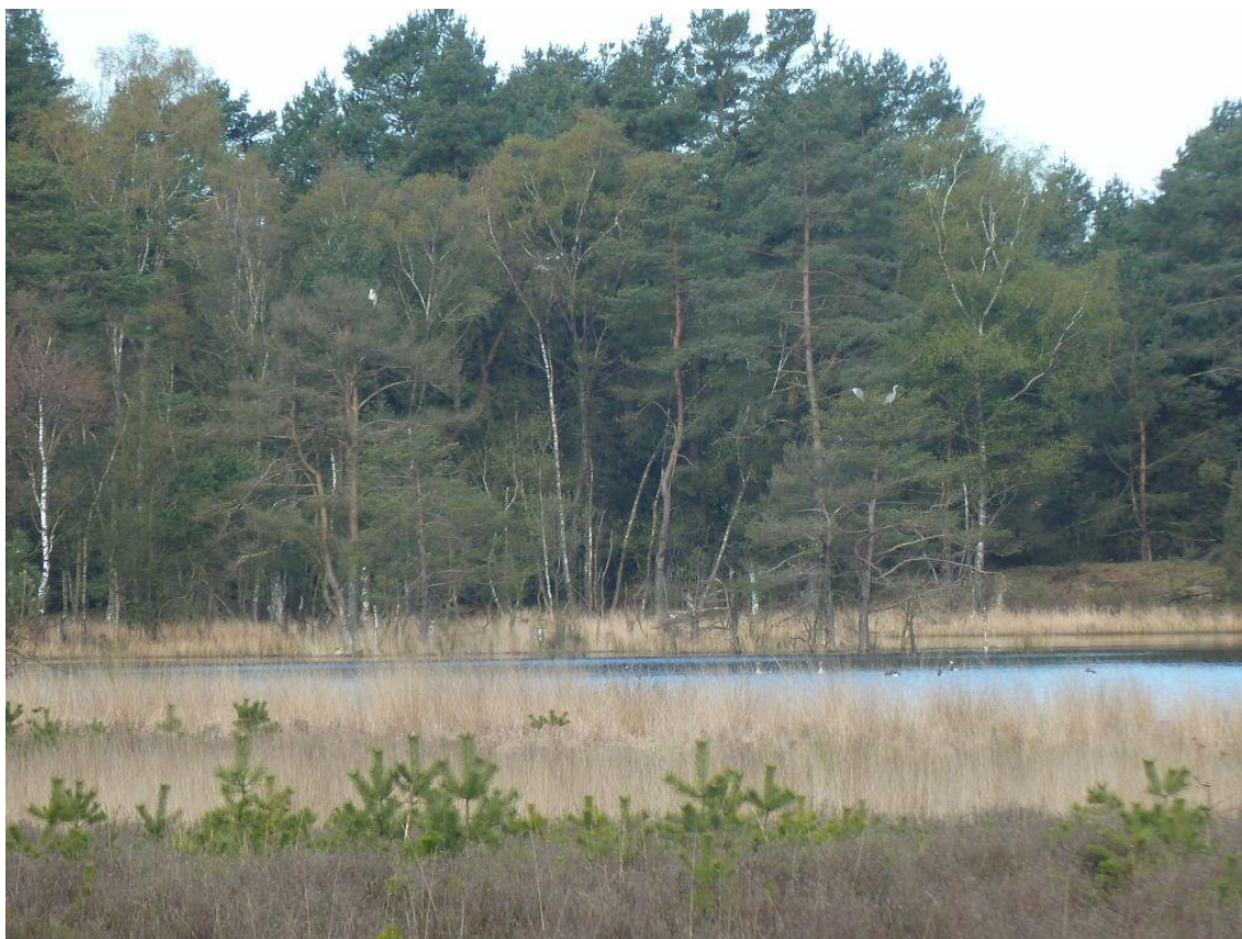
Zowel Blauwe Reigers als Grote Zilverreigers slapen in toppen van grove dennen langs de Gerritsfles, 1 mei 2016.