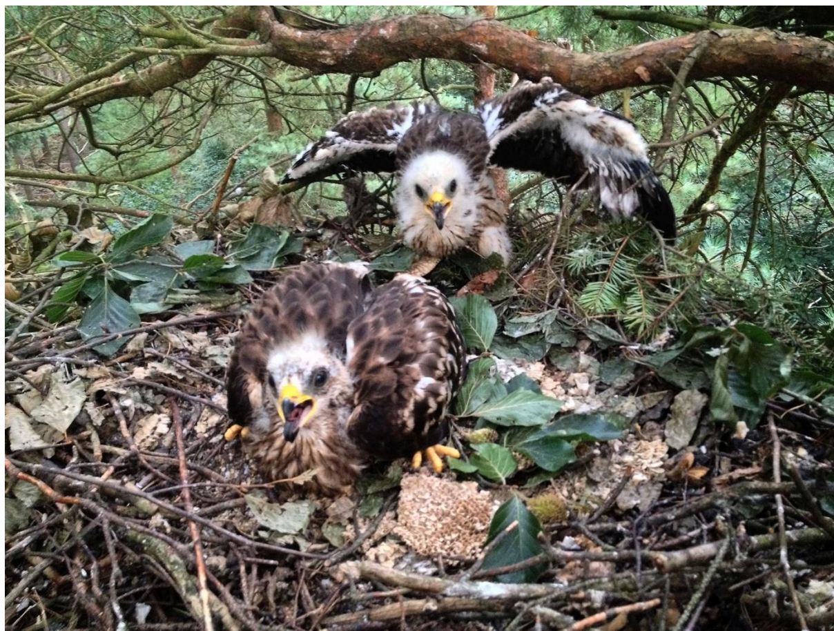
De twee jonge Wespendieven met fraai bebladerd nest met raten, 29 juli 2016 (Hugh Jansman).

In 2014 werd predatie van Wespendief door een Boommarter vastgesteld op een toenmalig bezet nest in een lariksvak in de directe nabijheid van het Staatsbosbeheerkantoor Otterloseweg 116 Ugchelen waarbij ook een ei werd aangetroffen: http://waarneming.nl/waarneming/view/85464407