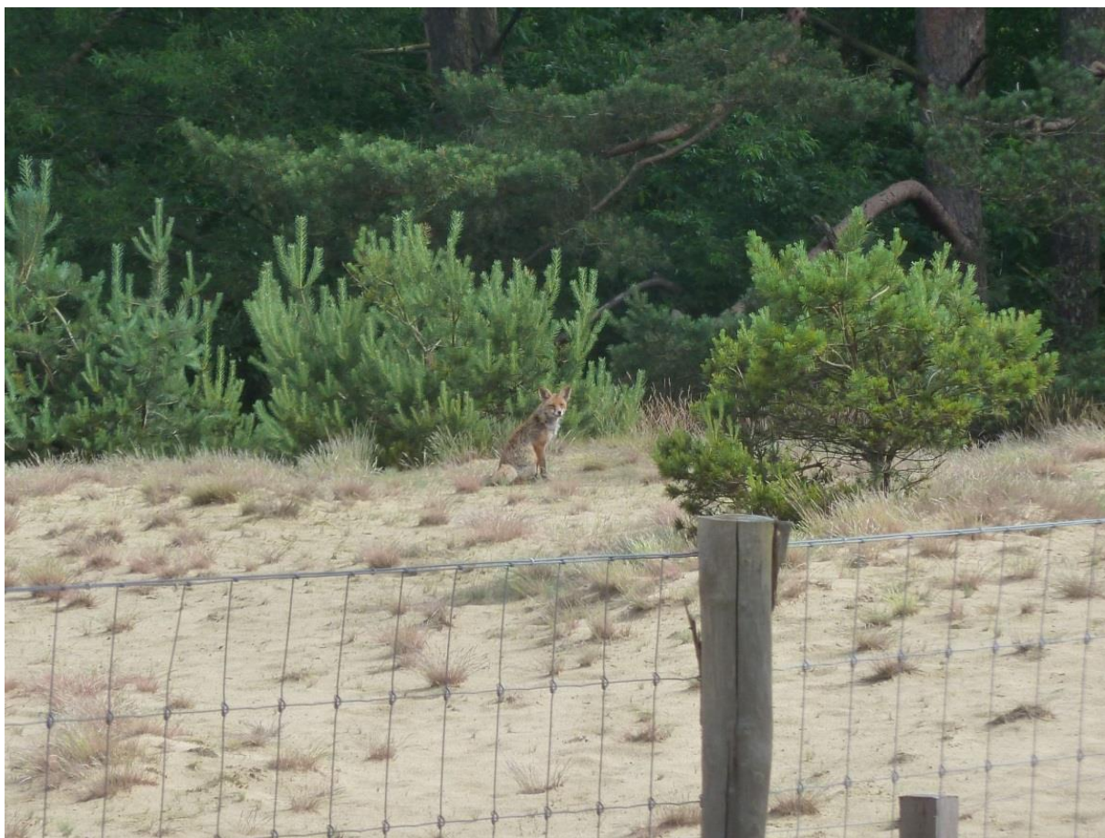
Vos, met welpen in de nabijheid, in het wengebied van de Wisent, ISK Harskamp, 19 juni 2016.

In een groot deel van de bossen heerst tegenwoordig meer rust, doordat op vrij grote schaal wandelpaden onbruikbaar zijn gemaakt, waardoor grotere en rustigere bosvakken zijn ontstaan. Dit is vooral gedaan voor het wild, t.b.v. het vergroten van de wildzichtbaarheid voor recreanten, maar voor broedvogels zal dit ongetwijfeld ook gunstig zijn.