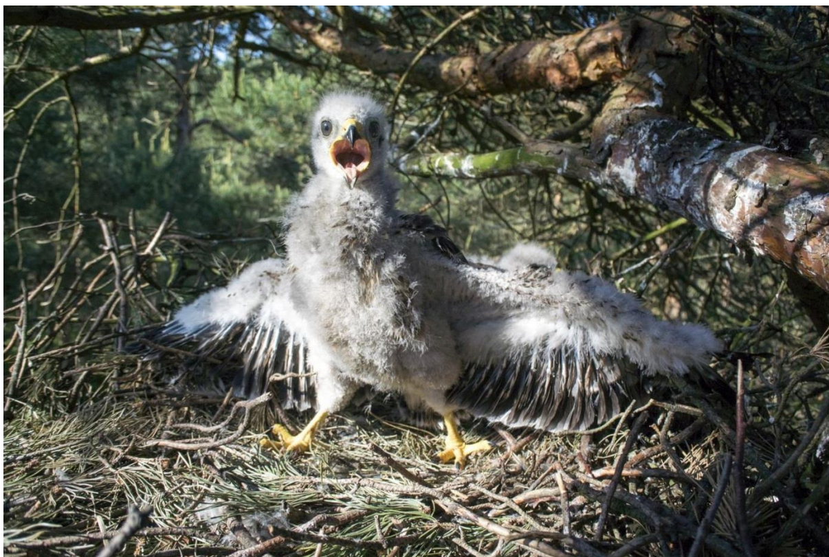
Eén van de twee jonge Buizerds op het nest in een Grove Den op Hoog-Buurlo, 5 juni 2016 (Hugh Jansman).

Bij vier van de zes nesten met jongen kon het broedsucces worden gevolgd. De paren begonnen vrij vroeg met de eileg, gemiddeld op 8 april (5/4, 6/4, 7/4 en 16/4). Op de nesten werden gemiddeld 2,3 jongen aangetroffen. In de twee overige nesten werden minimaal twee jongen per nest aangetroffen. Per aanwezig paar komt dat neer op 1,1 jongen, wat heel aardig is voor Buizerds in grote aaneengesloten bossen.