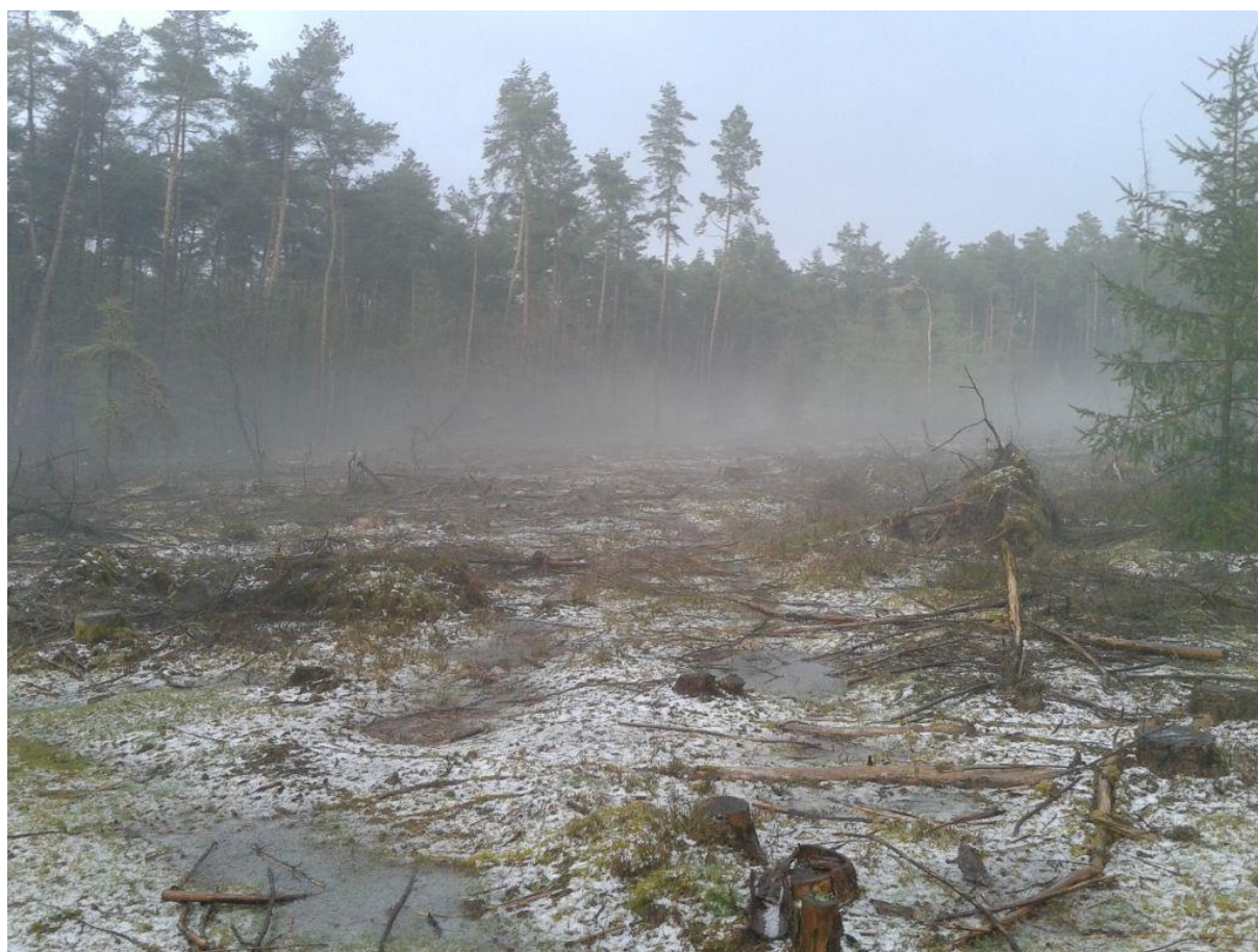
Eén van de vele kleine kapvlaktes na hevige hagelbui, Spelderholt, 13 april 2016.

Bij de kartering zijn geen omstandigheden opgetreden die de resultaten merkbaar hebben beïnvloed.