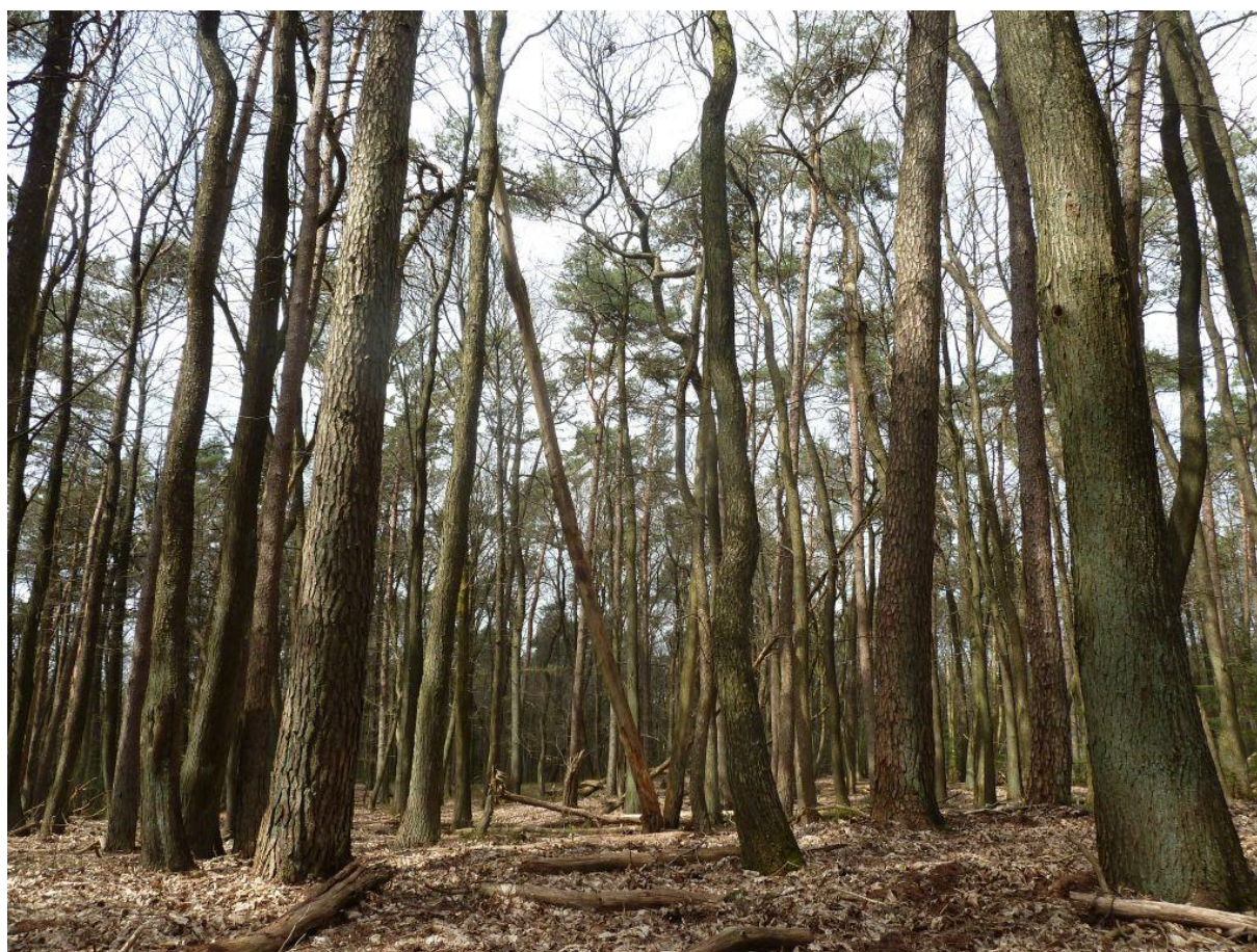
Oud gemengd bos met eiken, kastanjes en grove dennen, Ugchelse bos, 22 april 2016.

Ten oosten van de Otterloseweg ligt heideveld Het Leesten of de Leesterheide. Het is landschappelijk zeer fraai en ligt op de oostflank van een hoge stuwwal. Het gebied bestaat uit struikheide en wat open zand, met hier en daar zomen van open grove dennenbos. Er vindt seizoenbegrazing plaats door zo'n 25 schapen binnen een raster. Direct ten oosten van de Leesterheide ligt het Armenveld, een klein heideveld met reliëf, met enkele verspreid staande vliegdennen. Er is in de afgelopen jaren energie gestoken in het verder uitbreiden van open heideareaal. Zo is er in het winterseizoen van 2014/15 veel bos gekapt, zijn er kapvlakten ontstaan en zijn de heidevelden met elkaar verbonden. In een eerder stadium was er langs de noordrand van het Armenveld al veel grove dennenbos gekapt om ecologische verbindingen mogelijk te maken met het noordelijk gelegen heideveldje Wapenberg en het Salamandergat. Schenkenshul ligt ten oosten van Hoenderloo en bestaat uit een steile, met struikheide begroeide wal en kom. Het heideveld is in de afgelopen tien jaar regelmatig uitgebreid, door naastgelegen bos te kappen. De laatste uitbreiding was in het winterseizoen 2015/16. De uitbreidingen zijn vooral begroeid met bosbes, struikheide en bochtige smele.