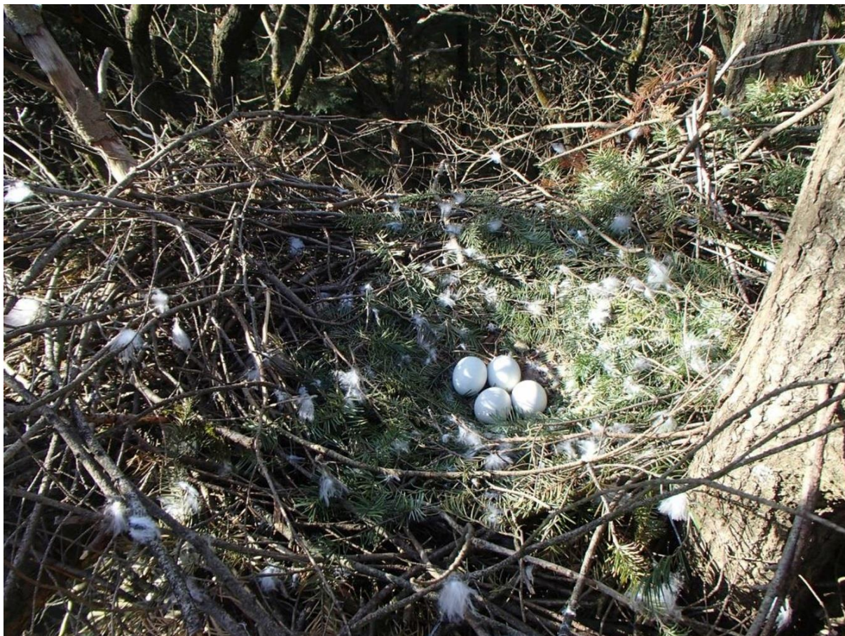
Vierlegsel van Havik in een eik, Vossenbos, 19 april 2016 (Willem van Manen).

De verspreiding was regelmatig verspreid over het beschikbare bosareaal, met 1100-3000 meter tussen de nesten. Opvallend is het ontbreken van een paar in het centrale deel van Ugehelen-Hoenderloo, rondom de Braamberg en het Hoenderlosche Bos. Bij alle paren werd een nest gevonden, waarbij opgemerkt moet worden dat vijf nesten zich buiten de grenzen van het studiegebied bevonden. Veruit favoriet was de douglas als nestboom (n=5), de andere drie nesten bevonden zich in een Japanse lariks, eik en een beuk. Twee van de zes gevolgde nesten waren niet succesvol. Het nest op het Leesten in een douglas werd wel opgebouwd, maar hier werden geen eieren gelegd en het nest ten noorden van Hoog Buurlo in een beuk werd wel bebroed, maar hier kwamen geen jongen groot. Van de succesvolle nesten werd gemiddeld genomen op 3 april begonnen met de eileg (31/3, 2/4, 6/4 en 7/4) en vlogen per succesvol nest 2,8 jongen uit (7 vrouwtjes en 4 mannetjes). Ten opzichte van de laatste metingen in 2007 en 2009 is de stand stabiel gebleven.