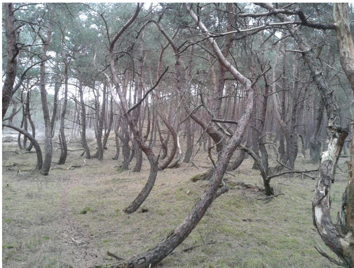
Merkwaardig kromgegroeide vliegdennen op de arme zandgronden van het ISK Harskamp, 20 maart 2016.

Een duidelijke zichtbare verandering in de bossen ten opzichte van 2007 betreft het creëren van grotere rustgebieden, door het ontoegankelijk maken van reguliere wandelpaden. Dit vond op grote schaal plaats over de gehele oppervlakte van het gebied. Hierdoor is er veel meer rust ontstaan in het bos.