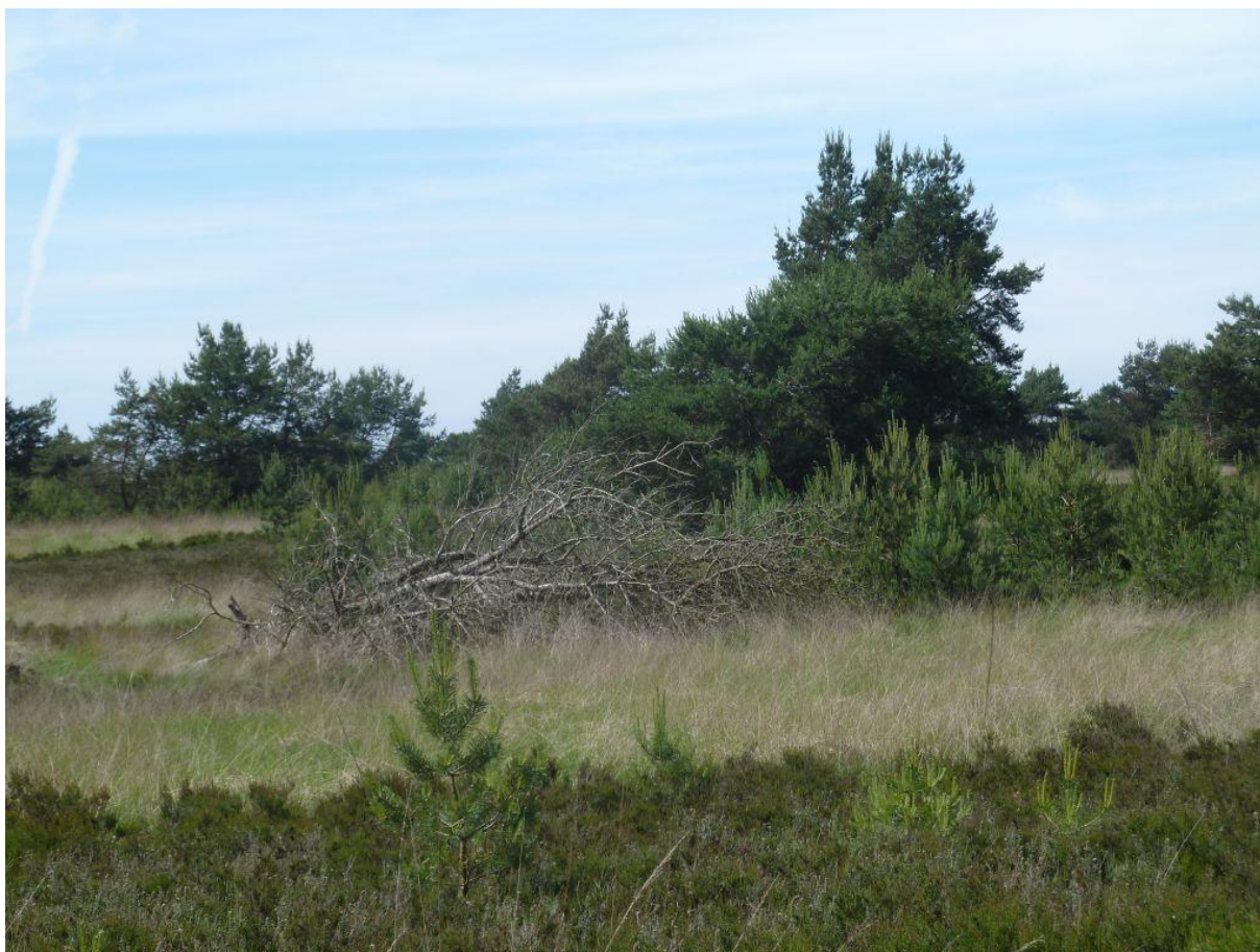
Broedbiotoop van de Grauwe Klauwier binnen het Wisentenraster op de Hoog-Buurlosche Heide. Het nest zat in de vliegeden op ongeveer 4 meter hoogte, 8 juni 2016.

vennetje op de heide, op ongeveer 4 meter hoogte. Ook dit nest was succesvol. Op 10 juli werden tenminste drie uitgevlogen en bedelende jongen gezien.