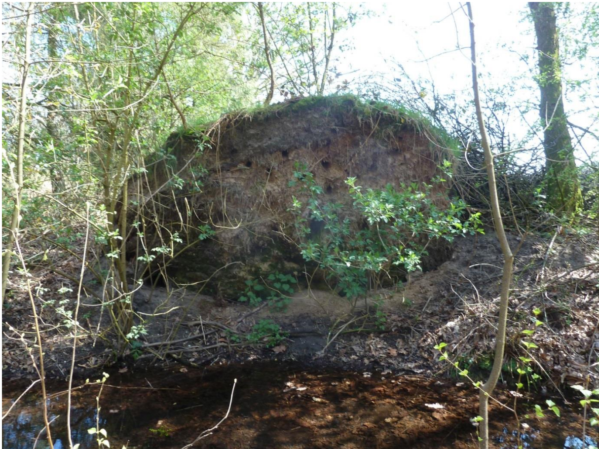
Favoriete kluit met nestpijpen van de IJsvogel langs de Koppelsprengen, 20 april 2016.

De sprenghol van de Koppensprengen is een ideaal biotoop voor IJsvogels. Tijdens iedere ronde werden IJsvogels gezien. De nestpijp bevond zich in de kluit van een omgevallen eik en werd op 22 maart 2016 gevonden. In de kluit bevonden zich maar liefst acht nestpijpen, waarvan er één bezet was.