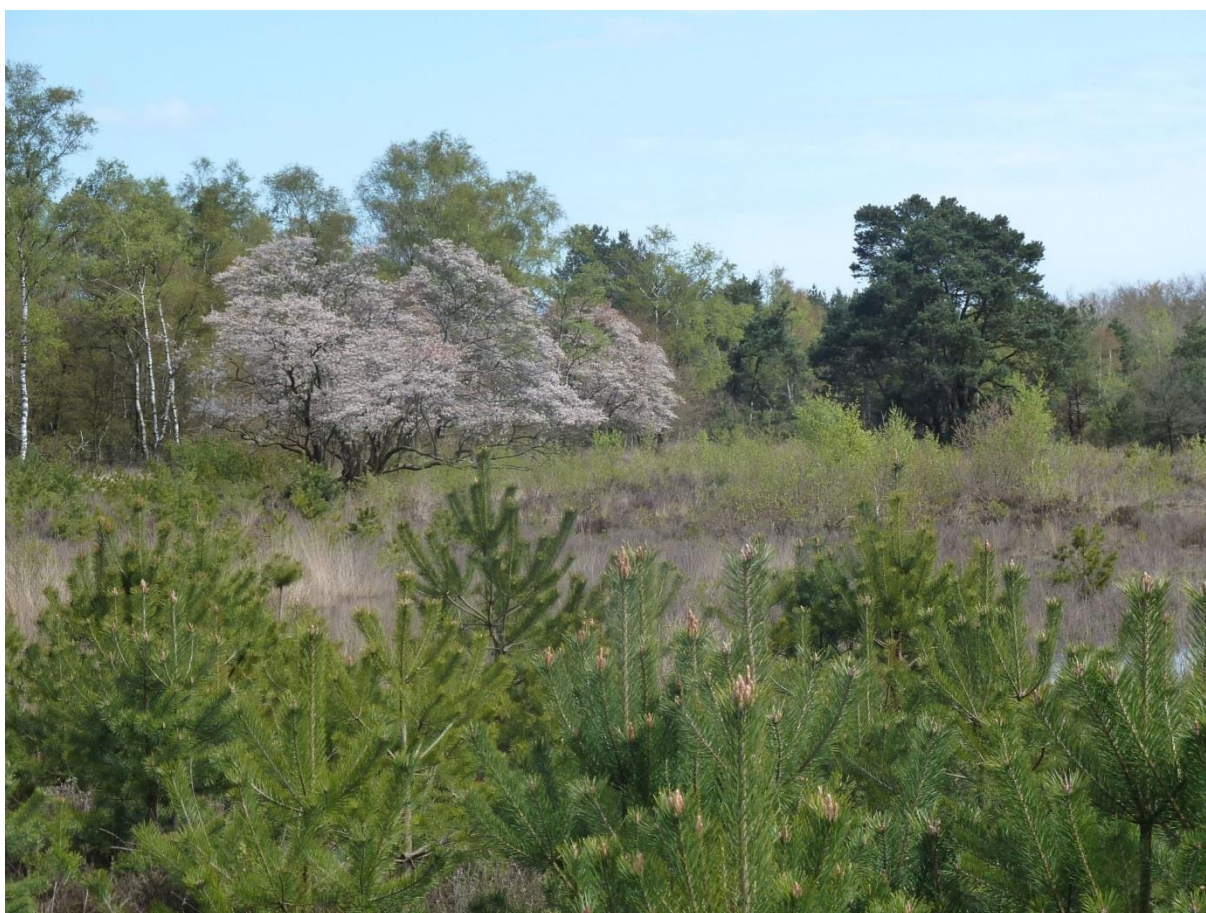
Het zeer afwisselende habitat langs de Gerritsfles, met natte heide, krentenboompjes en overgangen naar berkenbos, 1 mei 2016.