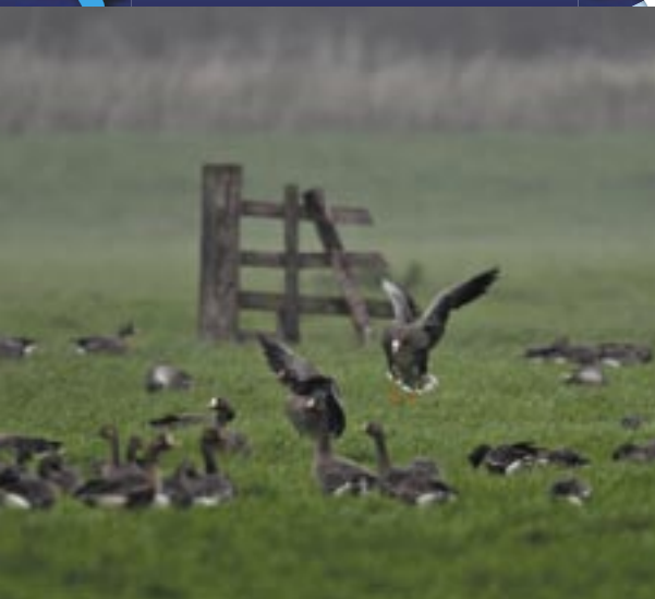
Een groep Kolganzen in de Alblasserwaard.