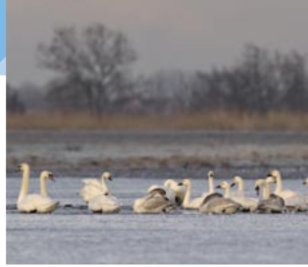
Kleine zwanen in de Polder Langenbroek, Alblasserwaard.

De hier aan de hand van de ganzen- en zwanentellingen gesignaleerde ontwikkelingen laten zien dat het traditionele ganzen- (en zwanen)seizoen in betrekkelijk korte tijd grote veranderingen heeft ondergaan. Dat geldt ook voor de spectaculaire toename van