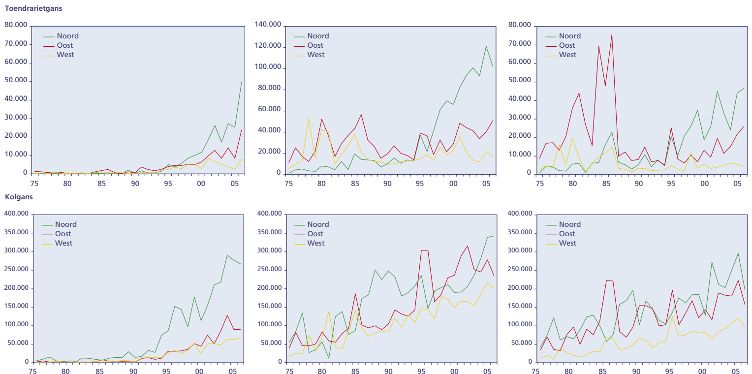
Figuur 2. Trends van Toendrarietgans en Kolgans in najaar (oktober-november), winter (december-januari) en voorjaar (februari-maart), opgesplitst naar Noord-, West- en Oost-Nederland. Weergegeven is het totaal aantal vogels over deze tweemaandelijke periode, uitgedrukt in het gemiddeld aantal per maand.