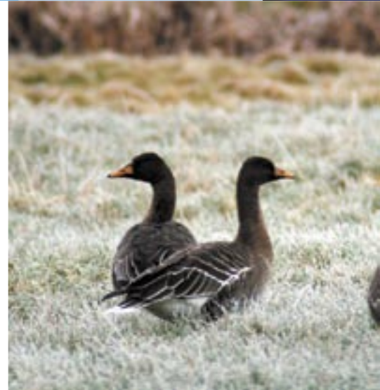
Taigarietganzen bij Bützow, Mecklenburg-Vorpommern, Duitsland, januari 2009.

De achtergronden voor de ontwikkelingen bij de Taigarietgans zijn niet helemaal duidelijk. De inkringing van het winterareaal zou een klimaateffect kunnen zijn (verkorting trekwegen), die ook geleid kan hebben tot winterconcentraties in landen als Polen. Daar worden momenteel nauwelijks ganzenstellingen uitgevoerd en worden mogelijk vogels gemist (wat zou betekenen dat de populatie minder is afgenomen dan wordt aangenomen). Opvallend is verder dat bij röntgenopnamen onder gevangen Taigarietganzen