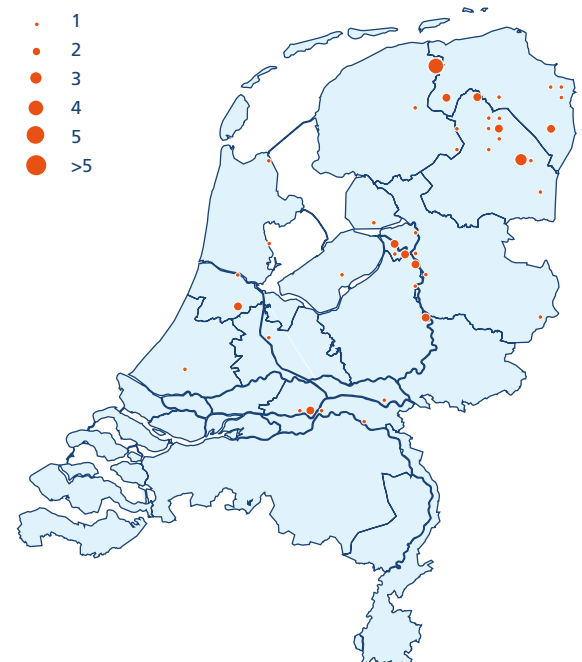
Figuur 2. Verspreiding van Kwartelkoningen in Nederland in 2010 (58 territoria).