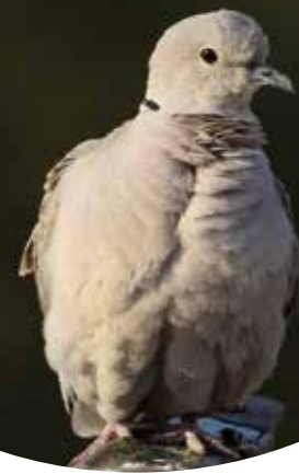
Er is een afname van de Turkse Tortel tijdens de MUS-tellingen geconstateerd, Ooijpolder, 30 april 2007.

In 2007 is het Meetnet Urbane Soorten gestart en afgelopen jaar beleefden we het tiende jaar. De eenvoudige en weinig tijd kostende opzet van punttellingen in dorpen en steden blijkt succesvol. Hoewel tien jaar niet echt als een jubileum te boek staat, kunnen we toch wel spreken van een mijlpaal. Hieronder in het kort de resultaten van 2016, het tiende jaar. Ook kijken we uit naar het elfde jaar waarin een aantal nieuwe dingen op stapel staan.