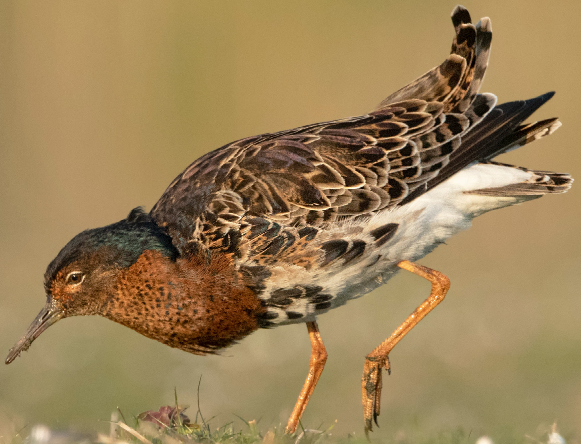
♠ Man Kemphaan in broedkleed, met kenmerkende kraag.