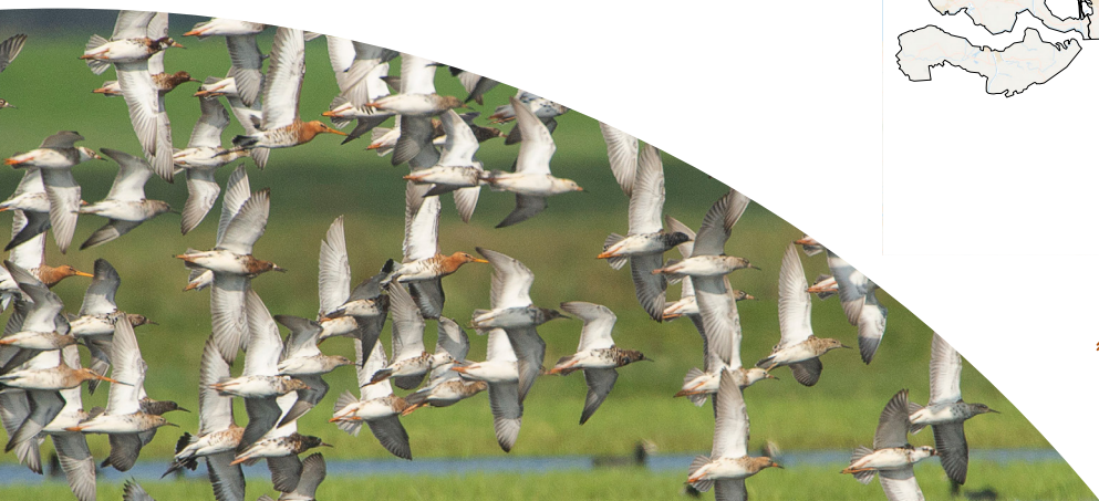
✦ Maximum aantal Kemphanen op slaapplaatsen in het voorjaar van 2023 (blauw). Getelde gebieden zonder Kemphanen zijn ook weergegeven (wit).