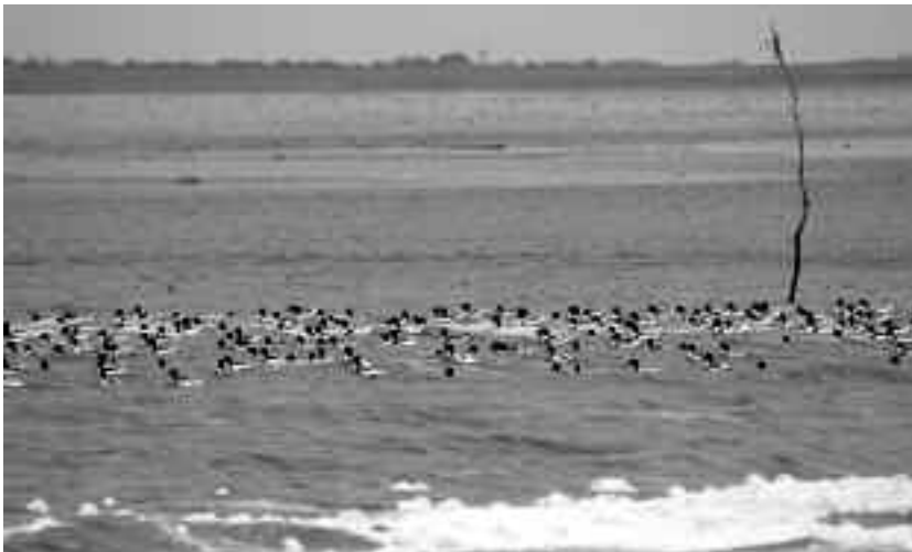
Een groep ruiende Bergeenden in de Oost Meep, augustus 2005. A group of moulting Shelduck.

Bovendien heeft dit gebied voor Bergeenden veel voedsel te bieden. De Slikgarnaal, een van de favoriete prooien (Swennen & Mulder 1995, Van de Kam et al. 1999), is hier volop aanwezig.