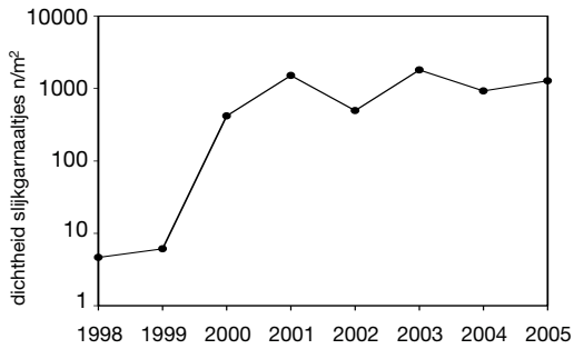
Figuur 2. Aantalsontwikkeling van Slikgarnalen op de Ballastplaat in 1998-2005. Population development of Corophium at the Ballastplaat in 1998-2005.