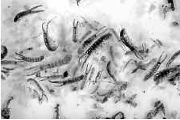
Vrijwel intacte en vermorzelde Slijkgarnalen Corophium volutator in bergeendenpoep van de Ballastplaat, augustus 2003. Voor de foto is een selectie gemaakt van de duidelijkste overblijfselen; de resten bestond grotendeels uit stukjes van de schildjes. Mudshrimp Corophium volutator remains in Shelduck droppings. The most complete remains were selected for the picture; most remains consisted of small fragments.

Ons bemonsteringsgebied beslaat 2600 monsterpunten verspreid over de gehele westelijke Waddenzee, maar Slijkgarnalen zijn nergens zo algemeen als op de Ballastplaat. Bergeenden foerageren voornamelijk tijdens afgaand water op de aanwezige Slijkgarnalen, terwijl ze bij hoogwater rusten. Sinds 1999 is de Slijkgarnaal spectaculair in aantal toegenomen, van gemiddeld minder dan 10 per m 2 tot en met 1999, tot meer dan 400 per m 2 in 2000 en de jaren erna (figuur 2). Deze toename zou verband kunnen houden met de afname van de aantallen Nonnetjes Macoma balthica en vooral van volwassen Kokkels Cerastoderma edule op de Ballastplaat (figuur 3). Er bestaat competitie om ruimte tussen Slijkgarnalen en Kokkels, waarbij de Kokkels d.m.v. bewegen en 'schudden' de gangenstelsels van de Slijkgarnalen vernietigen (Flach 1996).